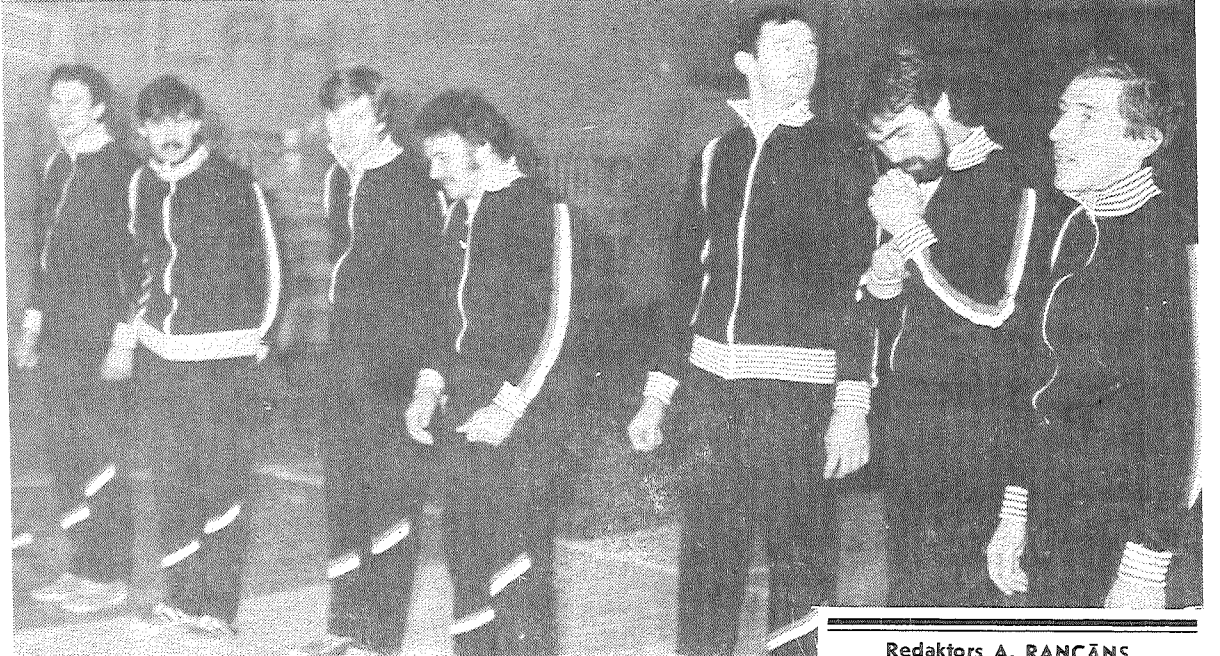
Redaktors A. RANCĀNS