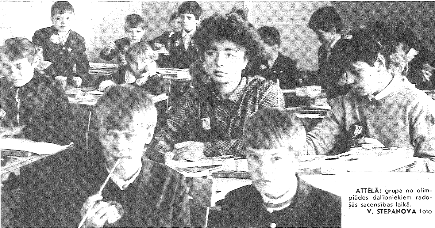
ATTĒLĀ: grupa no olimpiādes dalībniekiem radošās sacensības laikā.