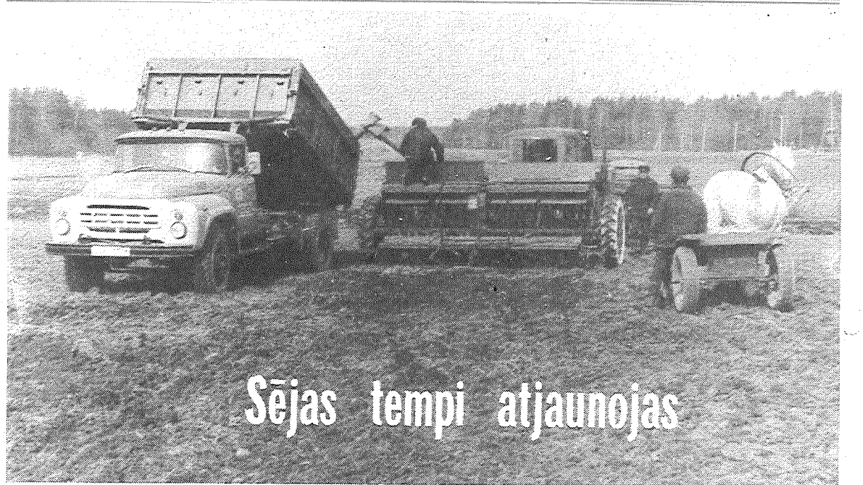
Sējas tempi atjaunojas