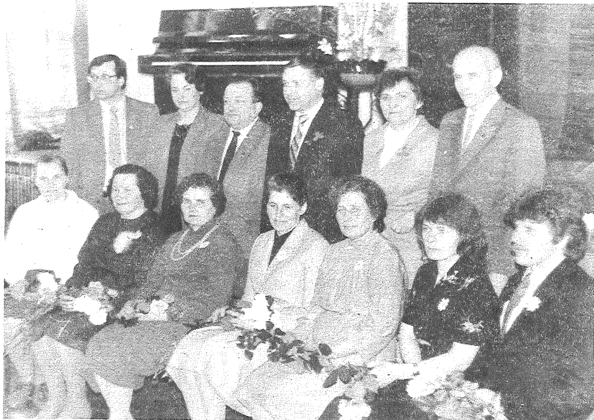
Sākums 1. lappusei

Uzņem tikai tos lopkopējus, kas nostrādājuši par mehanizētās slaušanas meistariem ne mazāk kā divus gadus. Darbs tiks organizēts četrās sekcijās — seštūkstošnieču, piektūkstošnieču, četrūkstošnieču un jauno lopkopēju sekcijā, kuras gadu cenzs — 30. Kluba Goda grāmatā tiks ierakstīti tie cilvēki, kas nostrādājuši par slaucēju 20 un vairāk gadus un izslauc pāri par 5000 kilogramu no katras Latvijas brūnās, 6000 kilogramu — no melnraibās un 6500 kilogramu piena no katras importa melnraibās govīs.