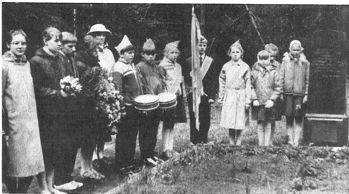
Uzvaras svētku priekšvakarā fašisma upuru kapos Riebiņu ciemā notika sēru mītiņš, kurā piedalījās ciema izpilkomitejas, kolhozagrofirms pārstāvji un vidusskolas delegācija. Skolēni nolika vainagus, sēru vītņi un ziedus visu to cilvēku piemiņai, kas gribēja redzēt vīras debesis, miera sauli.