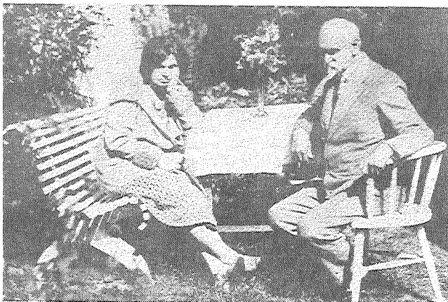
Attālā pa labi: Aspazija un Rainis 1905. godā Jaundubultūs, augšā — jī 1929. godā Majoru vosorneicas dorzā.