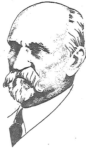
S. Vidberga zīmējums

Gon tī, kas byus, gon tī, kas beja, Nōk klōt pi tīm, kas šūbreid ir — Mes sovā vydā pīsapyldom Ar tū, kas vīnoj, na kas škir.