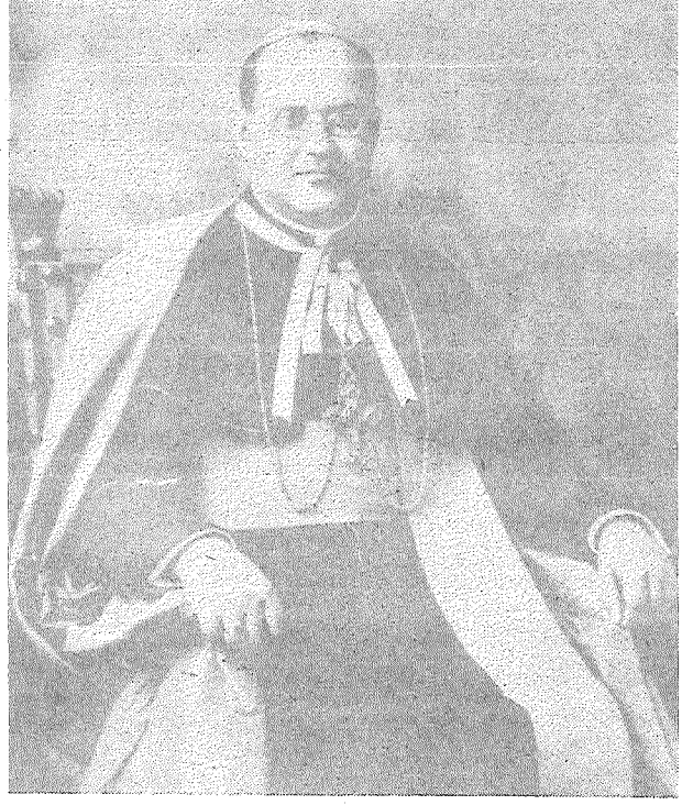
Attāllā: veiskups Jezups Rancāns Latvijā 1927. godā, tūlaik jys jau beja teologijas magīstrs, Reigas arciveiskupijas seminara rektors un ģenerālvīkērs, Saeimas lūceklis un plaši pazeistams sabīdryks darbītkis.

Rakstītkis Jōns Klīdzējs sovōs atminōs Jezupu Rancānu nūsaucis par boltū veiskupu, jū vōrdū jys tōjīs Grandlapidūs, kur dzeivōja. Un vai šaidis tītūs nav daudz nūzeimeigs, vai naizsoka ēri cylvāka dvēseli?