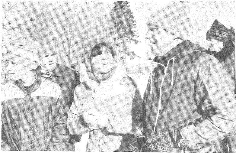
Vēl mirklis, un sāksies darbs tiesnešu brigādei.