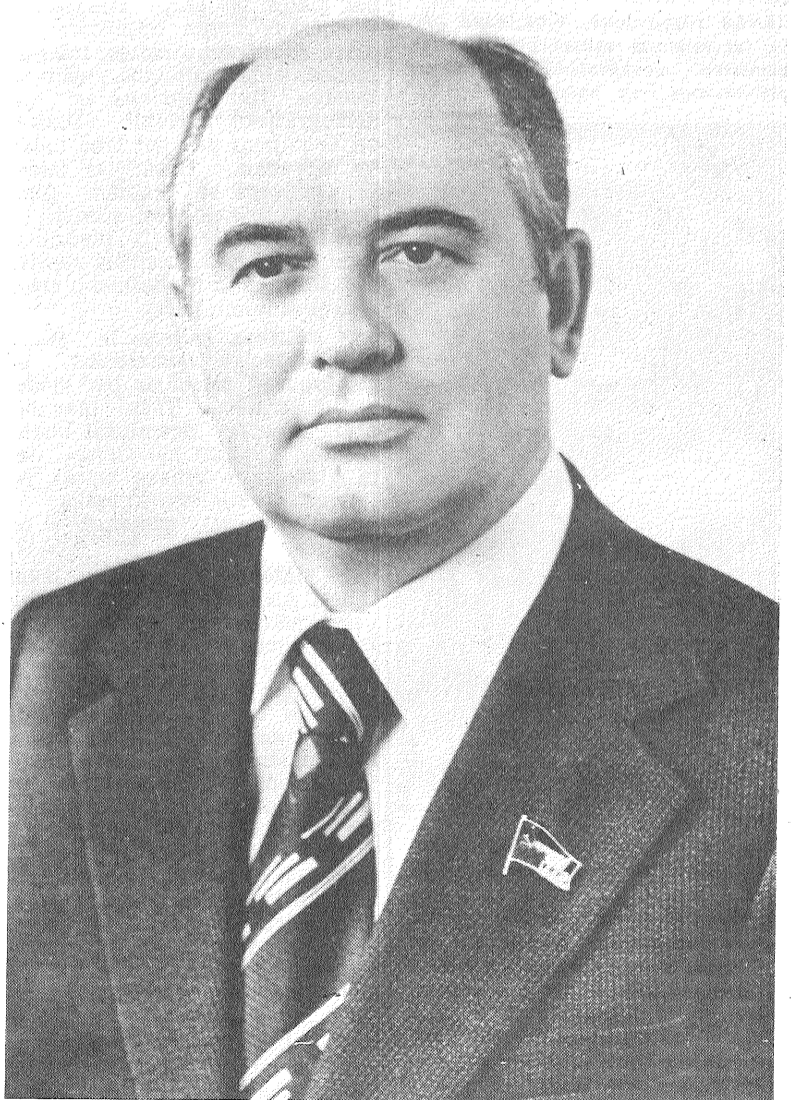
M. GORBAČOVŠ, PSKP CK ģenerālsēdētārs