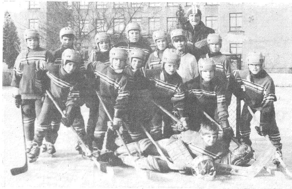
ATTEĻĀ: jaunākās grupas komanda, kas turnīrā «Zelta ripa» izcīnīja bronzas medaļas.

Jārūnā par dažām negatīvām tendencēm «Zelta ripas» turnīra rajona sacensību organizēšanā. Joprojām jaunie hokejistiem nav pienācīga ekipējuma. Skatītājiem, arī pašiem spēlētājiem garastāvokli bojāja fakts, ka zēni laukumā izgāja vecos, izbalējušos, pat saplīsušos sporta tērpos, ka dažiem spēlētājiem nebija pat ķiveres. Un tas atkārtos gadu no gada. Atbilstošas formas trūkums ir par iemeslu biežajam traumam. Zēniem patik spēlēt hokeju — īstu vīru spēli. Taču šī spēle prasa lielu darbu, sacensības — nopietnu organizēšanu. Domāju, būs pareizi, ja nākamgad sacensības neatlausim piedalīties komandām, kurām nav atbilstoša ekipējuma.