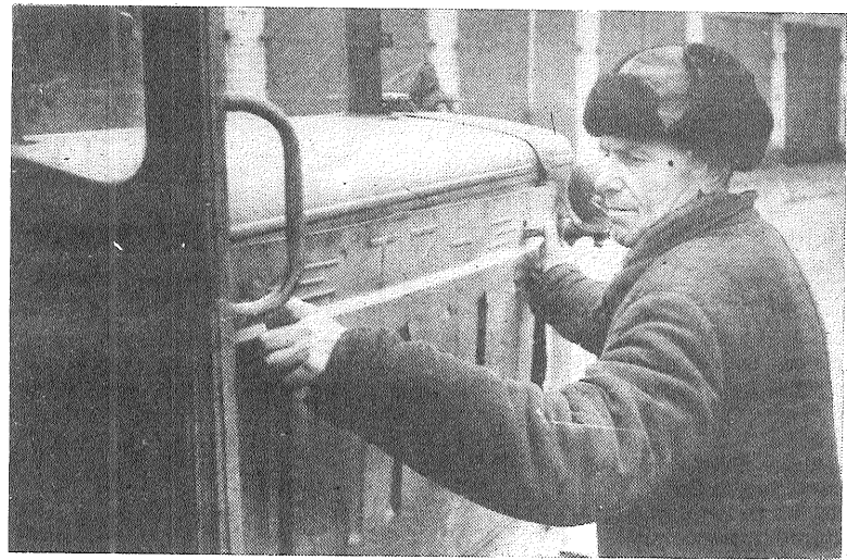
Aglonas padomju saimniecības mehanizatori gatavoja pavasara lauku darbiem. Sakārtoti 90 procenti traktoru, nepieciešamais piekabes inventārs. Līdz sējas sākumam dažiem piekabes rīkiem vēl jāzādara regulēšana.

Latvijas PSR Augstākās Padomes deputāte AGNĪJA IVANOVA (Preiļu 259. vēlēšanu apgabals) pieņems vēletājus Preiļu pilsētas izpildkomitejā 11. aprīlī no plkst. 16.00 līdz 18.00.