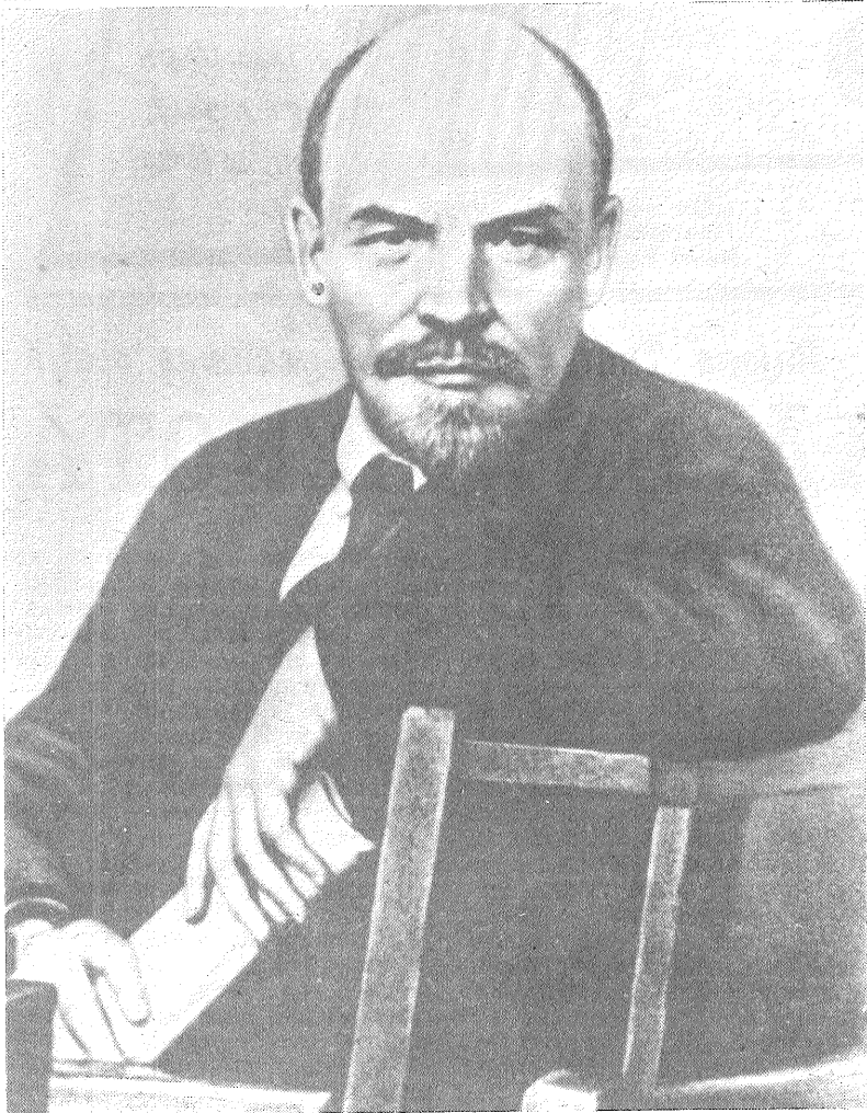
V. I. Leņins KK(b)P X Viskrievijas konferencē 1921. gada maijā. Fotografijas «V. I. Leņins KK(b)P X Viskrievijas konferences delegātu vidū» fragments.