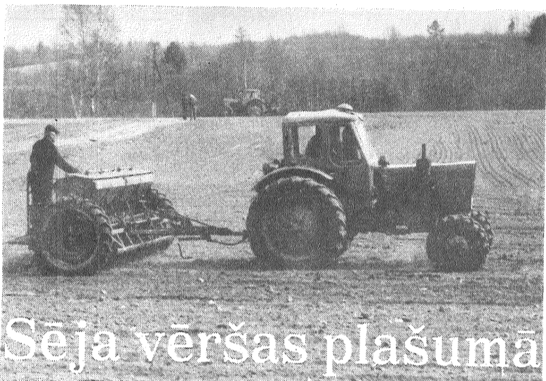
Sēja vērsas plašumā

Šogad pavasaris ar saviem sil- tuma un aukstuma periodiem tā sagrozīja laika prognozes, ka cilvēki sāka skeptiski vīpsnāt par to patiesumu. Kad nāca ziņa, ka rudenīgi aukstās lietūs šaltis no- mainīs silts, saulains laiks, viņi savu kritisko nostāju nemainīja. Redzēs, kad nu būs tās saules dienas.