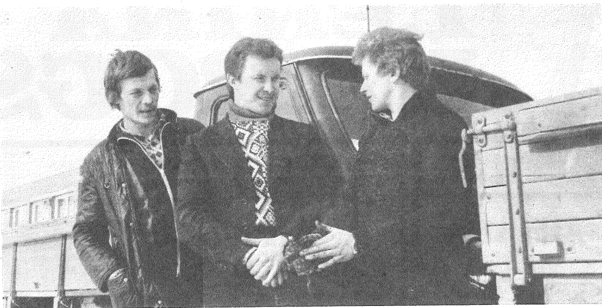
Lauksaimniecības dzīvnieku mākslīgās apsēklošanas organizācijā starp autovadītājiem ir daudz jauniešu. Viņi sekmīgi veic savus pienākumus, neatpaliek no pieredzējušajiem darbiniekiem. Katru nedēļu autovadītājiem jāizbrauc noteikts maršruts pa rajona saim-

A. NIKITOVA, Līvānu 1. vidusskolas propagandiste