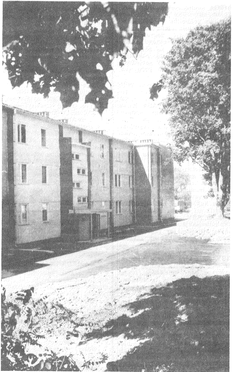
Preiļos nodota ekspluatācijā jauna 27 dzīvokļu māja. Tajā dzīvos «Lauktehnikas» rajona apvienības virpolaļi, celtnieki, šoferi un citi darba darītāji. Māju uzbūvējuši apvienības celtnieki, tā ļoti iekļaujas apkārtnē, atnauv. Veikti labiekārtošanas darbi, saglabājot esošos apstādījumus, iekārtots spēļu laukums bērniem.