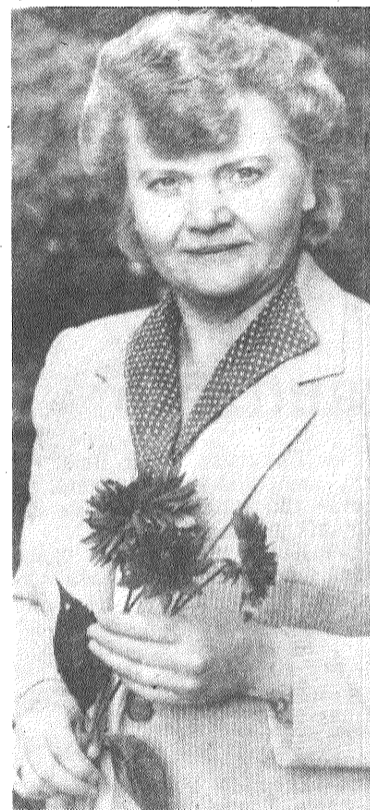
sev ko jaunu. Kā saka, mācot citus, mācāmies arī paši.

— Uzskatu, ka nav stingras robežas starp sabiedrisko un mācību darbu. Esmu tautas universitātes vecāku fakultātes rektore, nepārtraukti uzzinu un atklāju