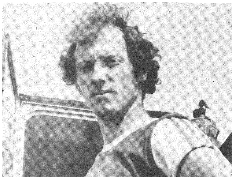
Labības novākšanu šogad organizēti veica kolhoza «Rīts» zemkopji. Tagad saimniecībā rit kartupeļu un dārzeņu novākšana, sākusies rudens aršana.