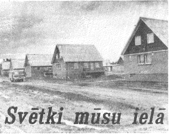
Svētki mūsu ielā

Desmit Suvorova kolhoza lauksaimniecības darbinieku ģimenes ievācās jaunajās Līvānu mājās. Radās jauna iela — katrā tās pusē pa piecām mājām.