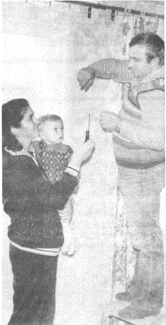
dāt, — saka māmiņa. — Gribu atdot visus savus spēkus, prasmi un enerģiju nu jau, ja varētu teikt, dzimtajam kolhozam. No šejienes ne par ko un nekur prom neiešu, par labu labāka jau nemeklē.

— Lai jau vēl paaugās mūsu mazulītis, lai pieņemtas spēkā! Paaugsies, atkal atsāks strādāt, — saka māmiņa. — Gribu atdot visus savus spēkus, prasmi un enerģiju nu jau, ja varētu teikt, dzimtajam kolhozam. No šejienes ne par ko un nekur prom neiešu, par labu labāka jau nemeklē.