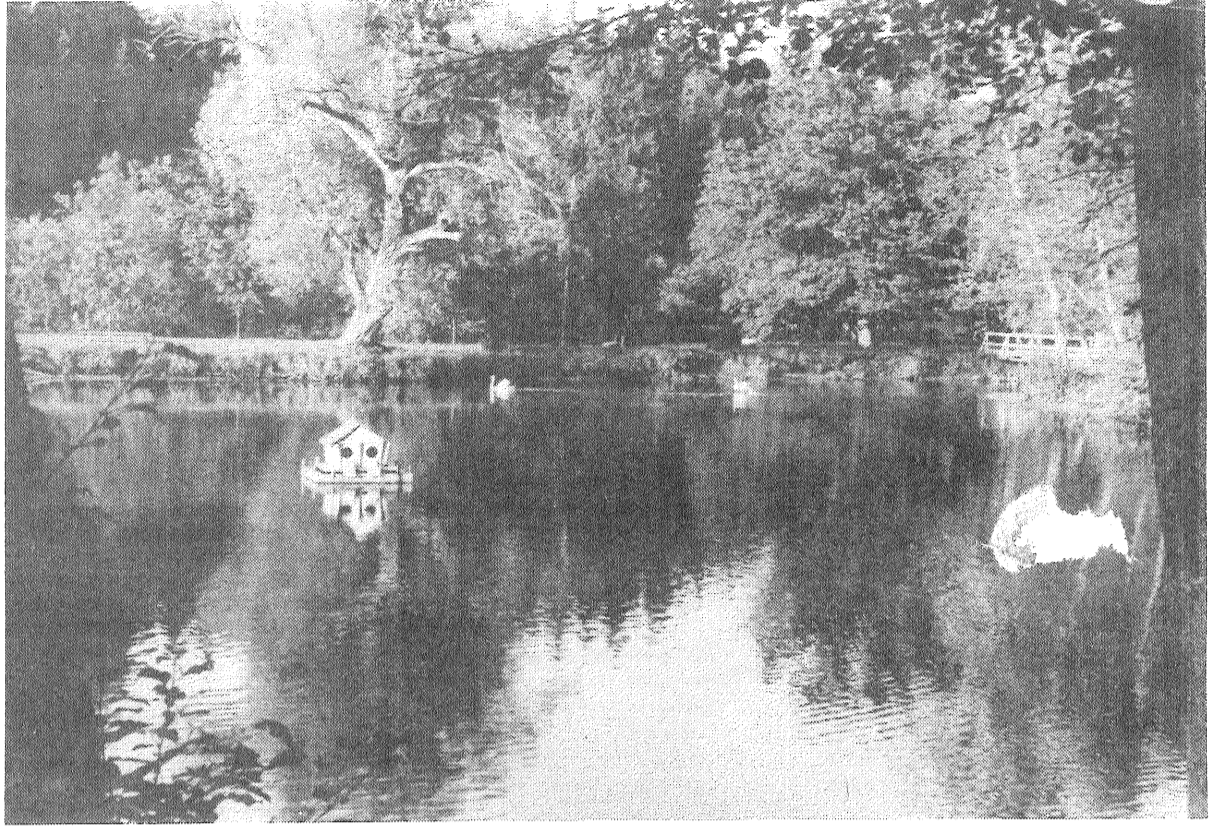
Gulbju dīķis Ligatnē (GNP).