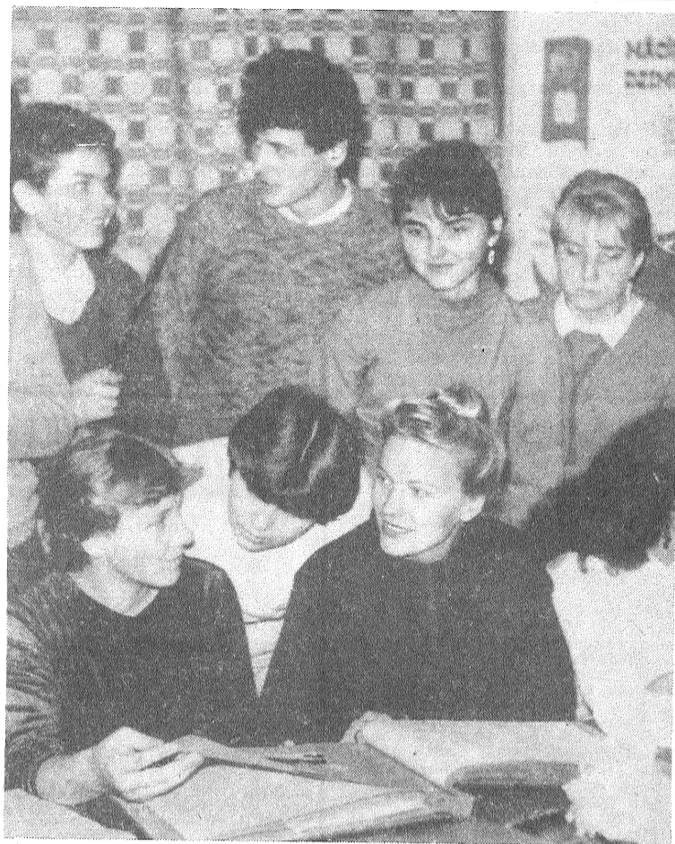
ATTEĻA: Sērečas skolēni Preiļu 1. vidusskolā. J. ZANDES foto