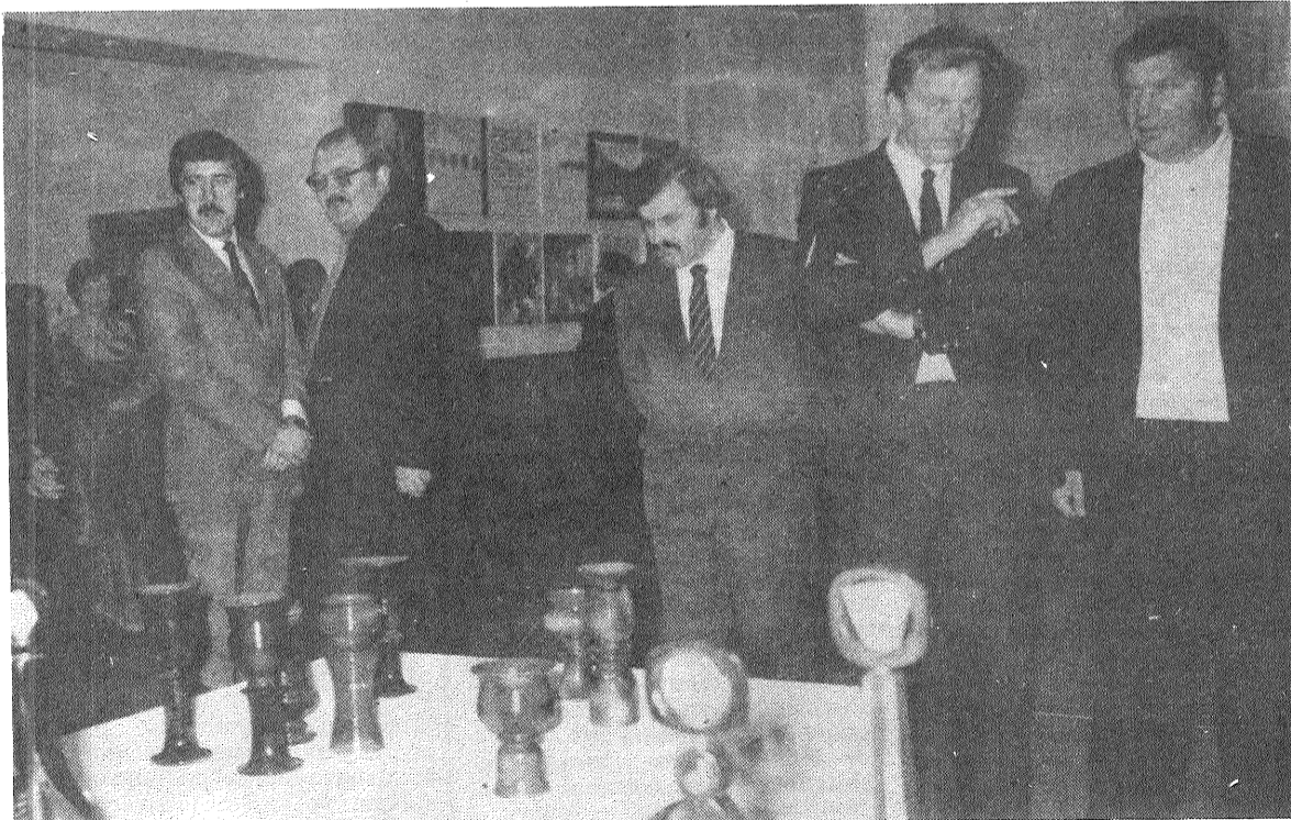
Iepazīšanās ar lietišķās mākslas meistarū darbu izstādi.

Materiālu publicēšanai sagatavoja K. PRIEDĪTIS