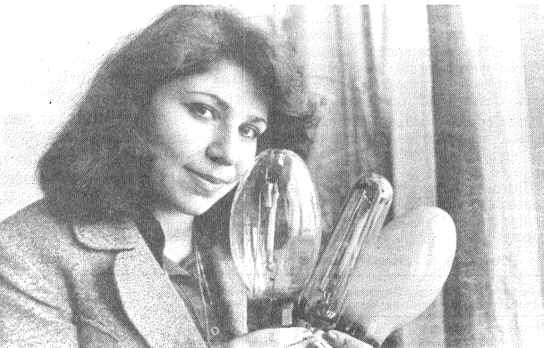
ATTELĀ: šie ekonomiskie gaismas ķermeņi ar mazjaudīgām gāzu izlādes spuldzēm paredzēti parku un lauku ciematu apgaismošanai.

Intensīvi tiek izstrādāti jauna veida gāzu izlādes gaismas ķermeņu paraugi, kurus paredzēts izmantot lielu laukumu, parku apgaismošanai. Ieviešot šo jaunā tipa apgaismojumu pilsētā, kuras iedzīvotāju skaits sasniedz vienu miljonu, gadā iespējams ietaupīt gandrīz 30 miljonus kilovatstundu elektroenerģijas.