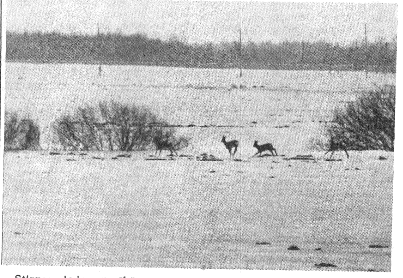
Stīrnas dodas ganībās.

personālais pensionārs, Nopelniem bagātais lauksaimniecības darbinieks