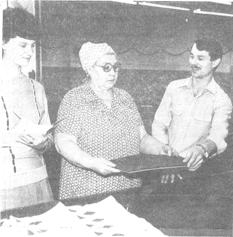
Preiļu trikotāžas fabrikas tautas kontroleriem rūpju netrūkst — regulāri tiek organizētas pārbaudes auduma piegriešanas iecirkņi (vai darba vietas atbilst normatīviem), tiek pārbaudīts, kā izlieto elektroenerģiju, smērvielas, utt. Pastāvīgi seko, lai ēdnīcā ievērotu sanitārijas normas, lai sadzīvēs telpās būtu vajadzīgā temperatūra un tīrība.

Partija un Centrālā Komiteja veic pasākumus, kas vērsti uz sociālistiskās iekārtas demokrātisma padziļināšanu. Pie tiem pieder padomju, arodbiedrību, komjaunatnes, darba kolektīvu un tautas kontroles aktivizēšanas un atklātuma pastiprināšanas pasākumi. Tomēr tas, kas paveikts un tiek darīts, ir jāvērtē nevis ar vakardienas mērķiem, bet ar jauno uzdevumu mērogu un sarežģītību. (No PSKP CK politiskā referāta PSKP XXVII kongresam)