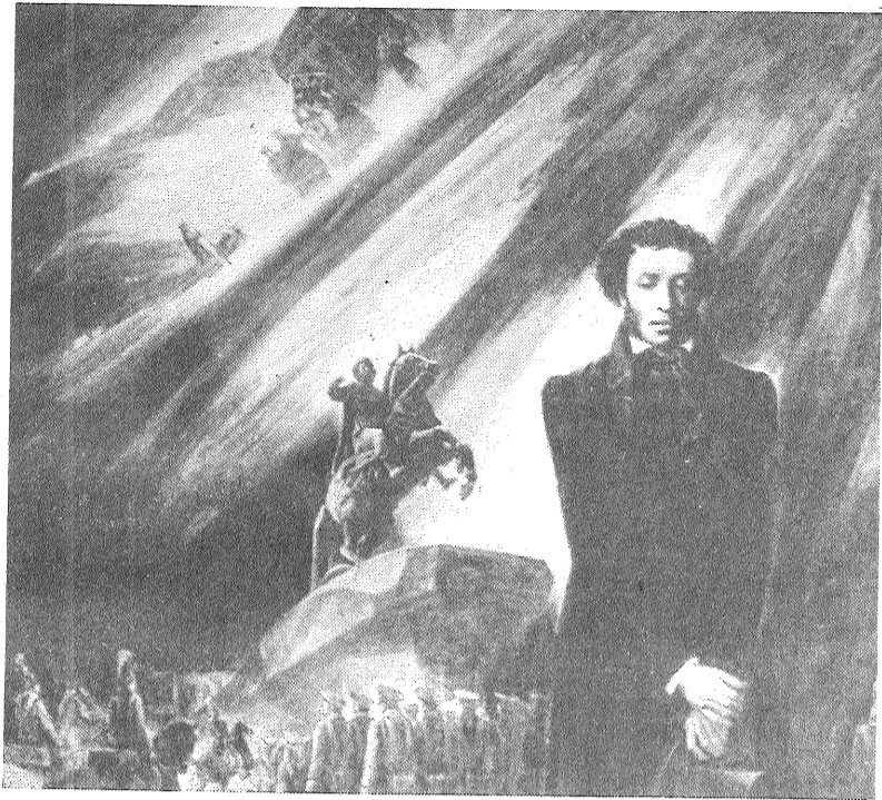
10. februārī, Puškina piemiņas diena, daudzi leņingradieši, kuri palikuši uzticīgi senajai tradīcijai, iegriežas memoriālajā dzīvoklī Moikas ielā 12, kur dzejnieks aizvadījis savas dzīves pēdējās stundas. Pateicoties ilgajai un pamatīgajai restaurācijai, dzīvoklis atguvis savu agrāko izskatu. Pēdējos gados pilsētā pakāpeniski atjaunotas jau vairākas ēkas, kurās kādreiz uzturējies Puškina: licejs, vasarnīca, visbēdzot — māja Moikas ielā. Vēlāk šeit tiks izveidots zinātnes un izglītības komplekss.