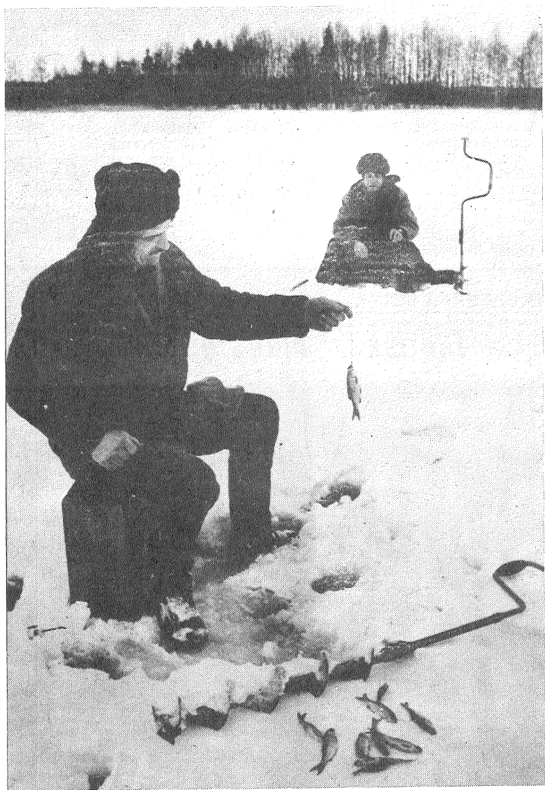
Kaķim jau ir...

Preiļu 7585. centrālās krājības revidente — grāmatvede