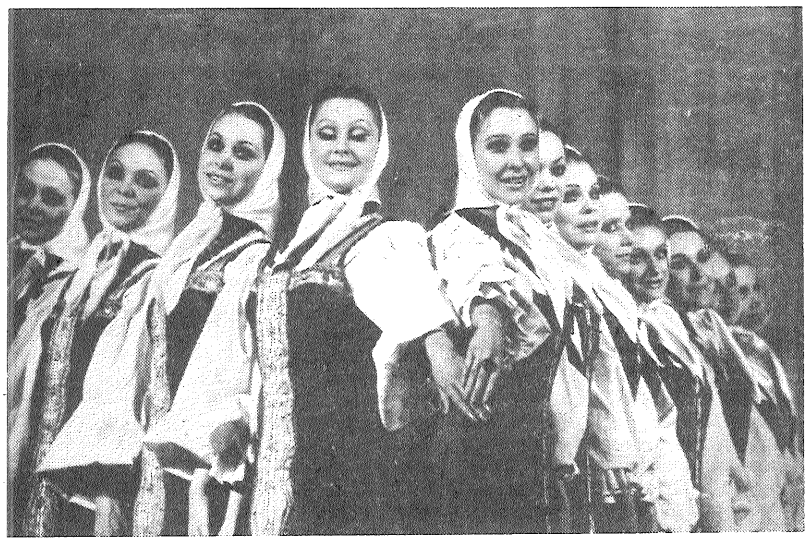
Valsts akadēmiskā horeogrāfiskā ansambļa «Berjocka» jauniešu grupas programmu visdrīzākajā laikā varēs noskatīties Voronežas, Kurskas, Belgorodas, Orlas, Tulas, Kalugas, Frunzes un Almaatas iedzīvotāji.

ATTEĻĀ: krievu tautas dejas — meiteņu rotaļa «Gulbītis».