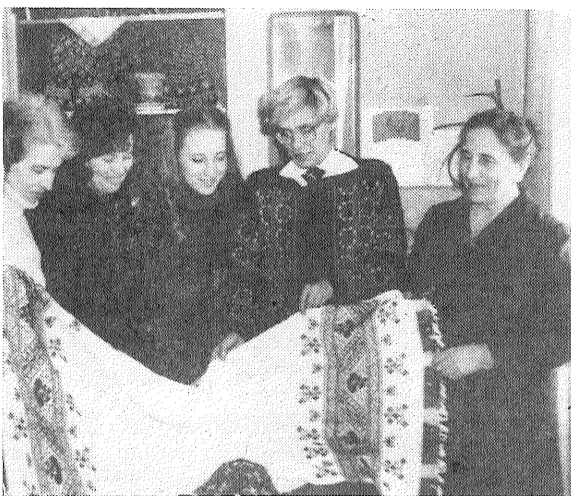
Mākslinieki no Rīgas kopā ar Līvānu mājrāzotā, jām apspriež iecirknī darinātās produkcijas kvalitāti.