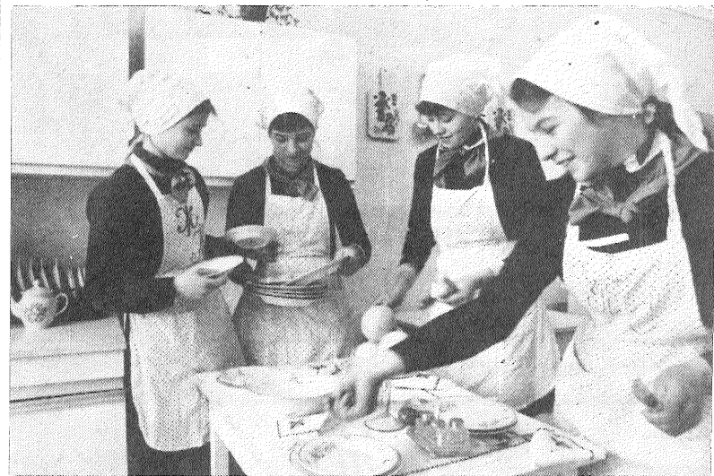
UKRAINAS PSR. Černovcu apgabala Hotinskas rajona Kolenkocvu ciemā uzcelta jauna vidusskola 1176 bērniem. Kabineti un laboratorijas apgādāti ar visdažādākajiem mācību un tehniskajiem līdzekļiem. Te iekārtota arī speciāla informātikas klase, kurā vecāko klašu skolēni apgūst lemaņas darbam ar skaitļošanas tehniku.

Lielā loma skolas programmā ieradīta darbaudzināšanai. ATTEĻA: speciāli iekārtotā klasē skolinieces apgūst mājsaimniecību.