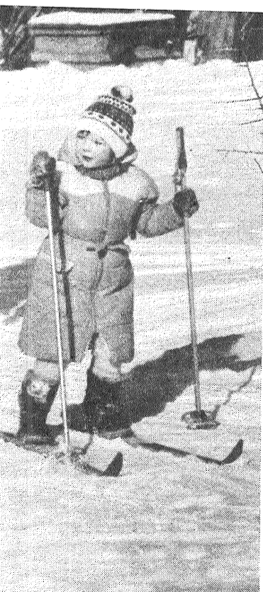
«Tētis, māmiņa, brālītis un es — visi mēs slēpojam.»

M. BINDUKA, Galēnu astorgadīgās skolas skolotāja