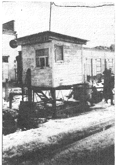
Mājiņa uz «vistas kājas».