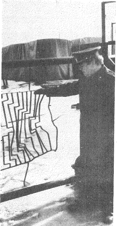
Vārti Līvānu māju būvētājus maz uztrauc.