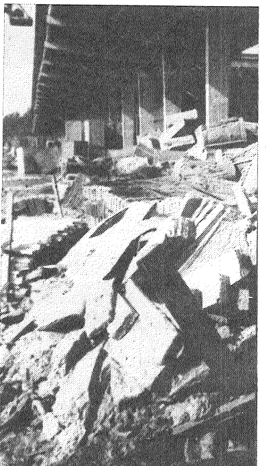
Minerālvates uzglabāšanas metodes ir «originālas».