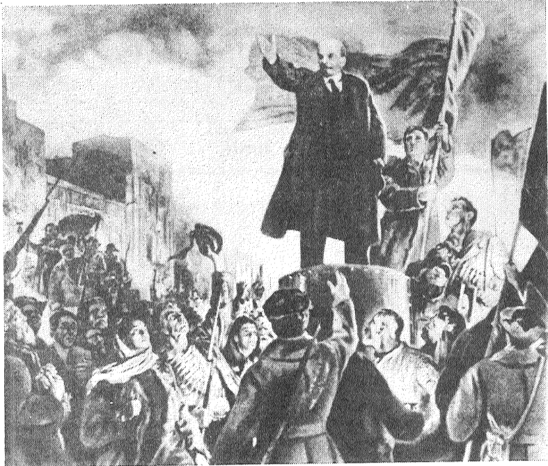
Mākslinieka I. Toidzes glezna «V. I. Leņina runa no bruņumašīnas pie Somijas dzelzceļa stacijas, 1917. gada 3. aprīlī».