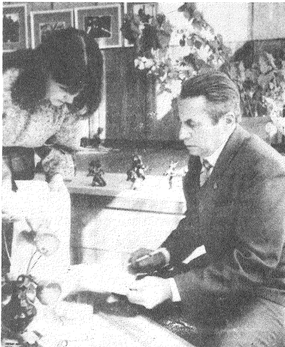
No izstādes daudzi aizgāja ar keramika Polikarpa Čerņavska autogrāfiem.