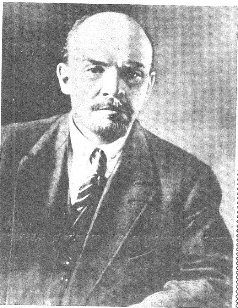
V. I. Ļeņins, 1920. gada jūlijs.