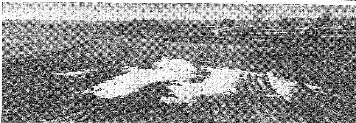
Latgalē tīrumi mostas.