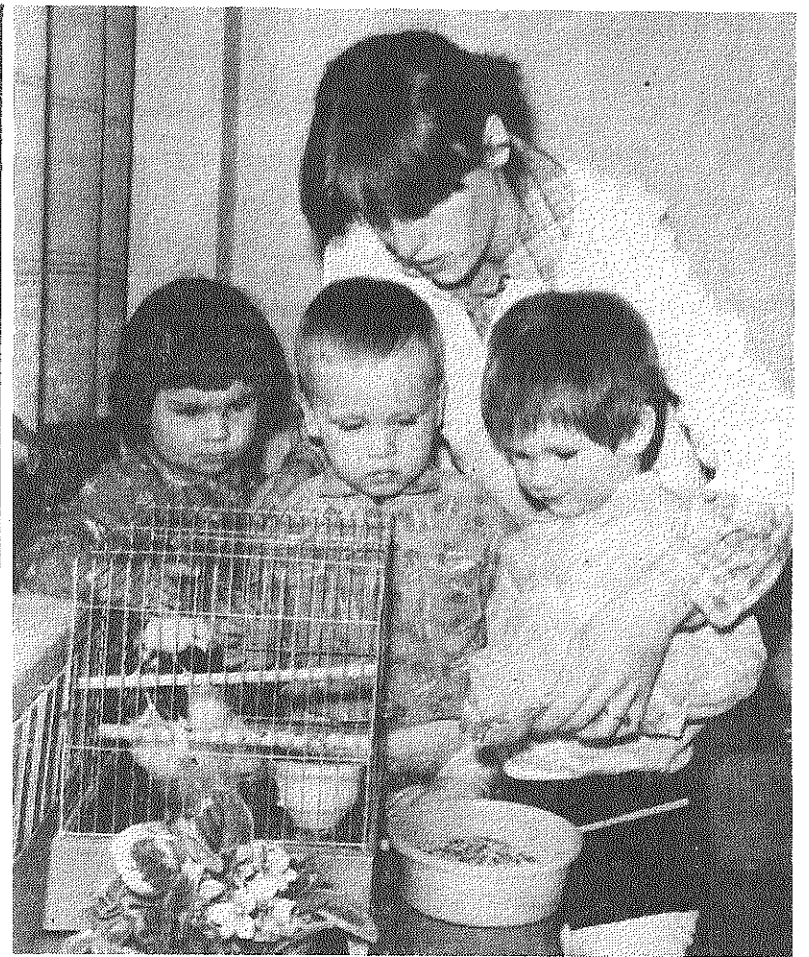
Rušonas padomju saimniecības bērnudārza medicīniskais un pedagoģiskais personāls veltī mazajiem visas savas rūpes un uzmanību.

rajona izpildkomitejas sociālās nodrošināšanas nodaļas vadītāja