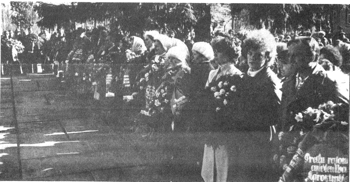
Mūsu novada atbrīvotāju pēdējās atdusas vietās ar ziediem nāk vienmēr. Ipaši daudz te cilvēku Uzvaras dienā.

Uzvaras švētki... Tā ir diena, kad godinām cīņā pret vācu fašismu kritušo varoņu piemiņu un cildinām Lielā Tēvijas kara veterānus. Tā ir diena, kad atceramies visas grūtības, kuras nācās pārciest mūsu tautai un to, cik upuru prasīja karš. Tāpēc šajā dienā skaļāk nekā citkārt skan mūsu balsis, prasot nepieļaut kara šausmas un darīt visu, lai saglabātu mieru uz planētas.