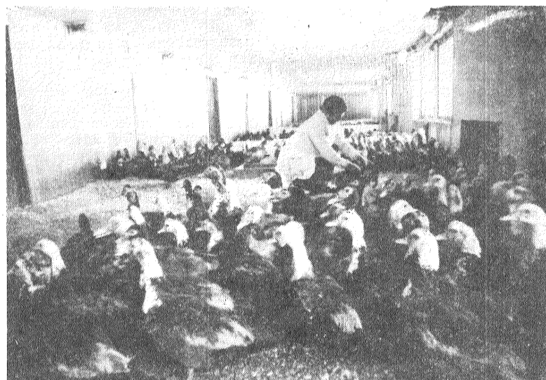
Muskuspīles saņem barību.

Izstrādāts konkrētu pasākumu plāns piena produkcijas ražošanas palielināšanai. Šī uzdevuma izpildī nēmitīgi kontrolē saimniecības partijas pirmorganizācija.