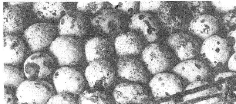
Paipalu olas ir gan delikatese, gan vērtīga bioloģiskās rūpniecības izejviela.