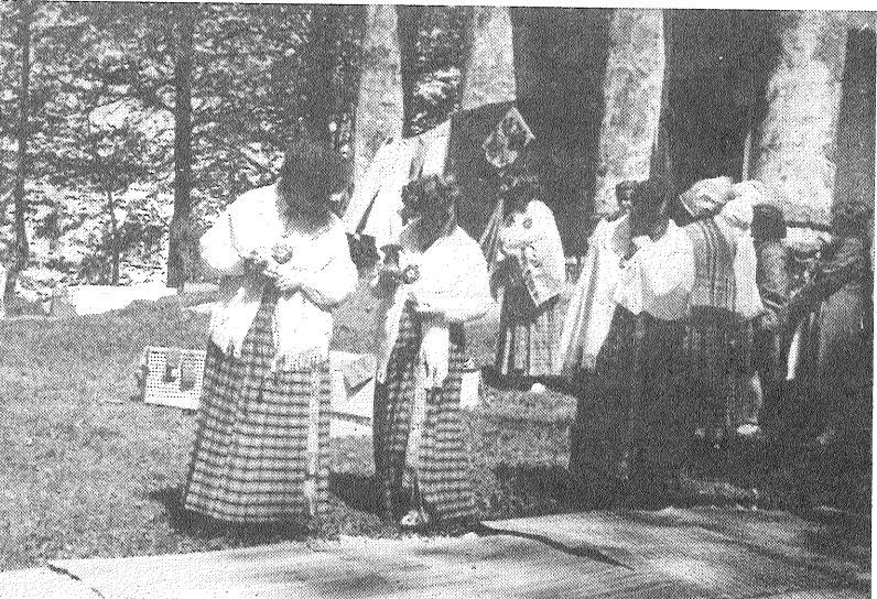
«Dubnas» audēju un adītāju prasmi novērtē Preiļu siera rūpnīcas folkloras ansambļa dziedātājas.