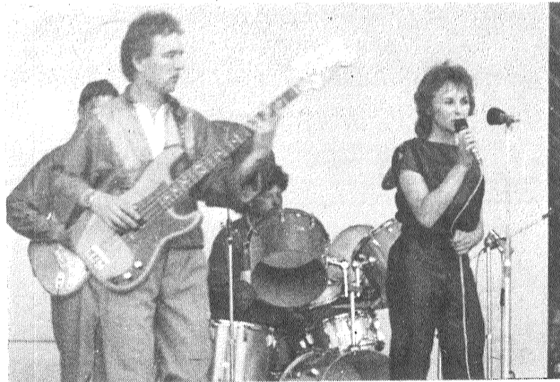
Atpūtas brīdī — pilsētas celtniekiem koncertu sniedz aģitvilciena «Ukrainas komjaunietis» maksliņieki.