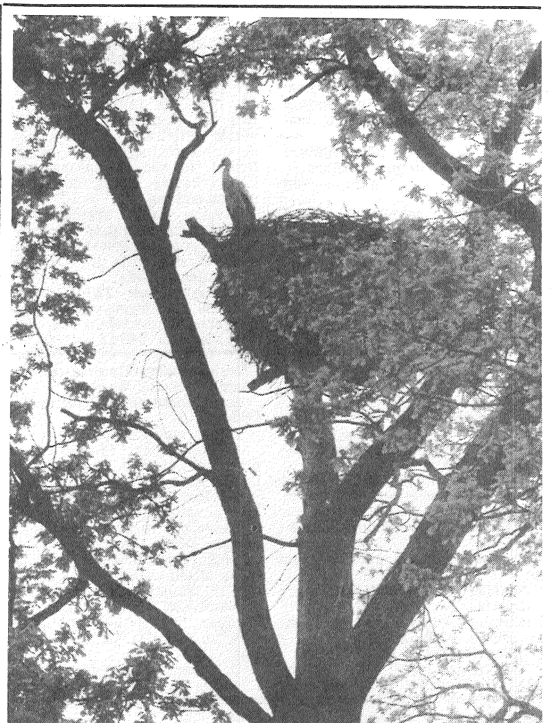
Vārkavas vecajā parkā kādā sir mē ozolā jau pusgadsimtu ligzdo ballais stārķis. Viņam no šejienes labi pārredzamas Dubnas liču plašās plavas.