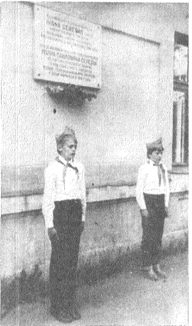
Pionieru goda sardze.