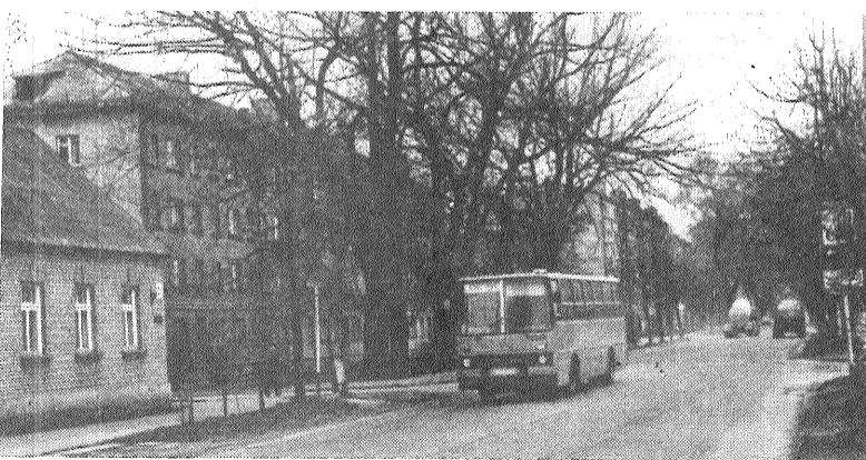
Ivana Seredas iela Daugavpili.