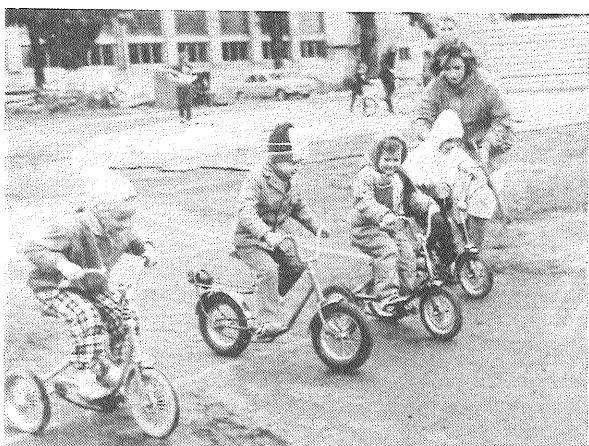
Ar lielu aizrautību allaž sacenšas mazie velosipēdisti.