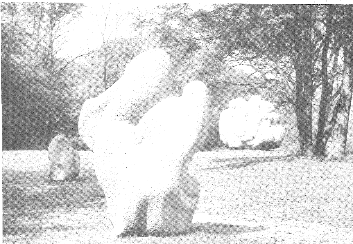
Arī Preiļu novada tautas dziesmas šovasar skanēja republikāniskajos Folkloras svētkos, kas šoreiz notika Siguldā un Turaidā.