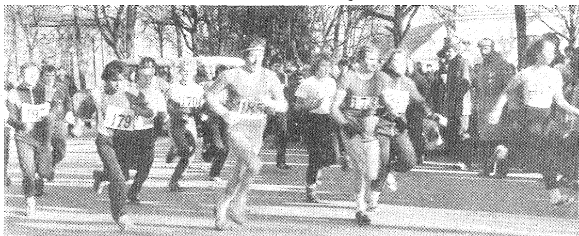
Preiļi balvām dodas 1959. gadā dzimuši un vecāki masu skrējiena dalībnieki.

Vairāk nekā divi simti sportistu izgāja Preiļu ielās, lai piedalītos sacensībās, kas bija veltītas Lielās Oktobra sociālistiskās revolūcijas 70. gadskārtai, — Preiļu 1. vidusskolas, Riebiņu, Aglonas vidusskolas, Preiļu 2. vidusskolas, Aizkalnes astoņgadīgās skolas, Rudzētu vidusskolas, padomju saimniecības «Aglona», agrofirmas «Krasnij Oktjabrj», kolhoza «Dzintars». Raiņa kolhoza, sakaru mezgla, Līvānu eksperimentālā māju būves kombināta fizikultūrieši.