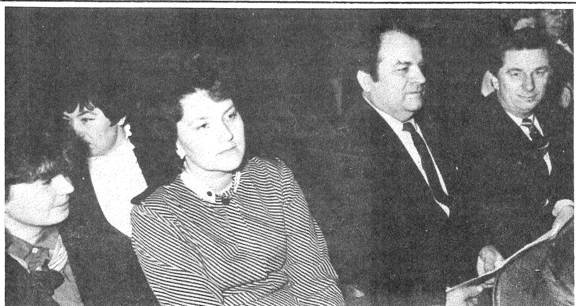
● Kā apliecina fotoattēls — seminārs noritēja radošā atmosfērā. Proti: vieniem runātāja sacītais bija jaunums, otri bija gatavi sākt diskusiju, trešie konsekventi palika pie savām domām un praksē pārbaudītām atziņām. Un tā taču ir, ka strīdos un meklējumos dzimst labākās idejas turpmākam darbam, kas mums visiem ir viens — jaunās paaudzes izglītošanas un komunistiskās audzināšanas kvalitātes paaugstināšana.