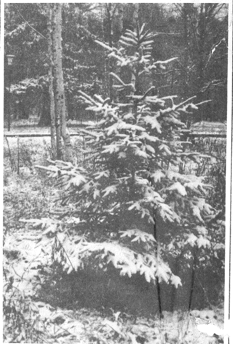
● Ziemas motīvs.