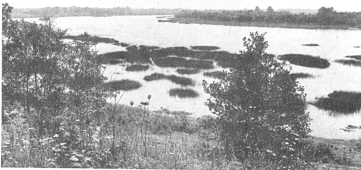
ATTEĻĀ: Daugava pie Jersikas pilskalna.

Pieminēsim pēdējo Jersikas valdnieku Visvaldi un mēģināsim saprast, ka viņš bija gudrs, tālredzīgs un lepns cilvēks, kas tikai savas tautas brīvības vārdā reiz zemojās vācu bruņinieku priekšā. Un vēl — Jersikai bija arī savi kaupi, savi jūdasi. Bet par to visu — vēlāk, vēstījuma gaitā.