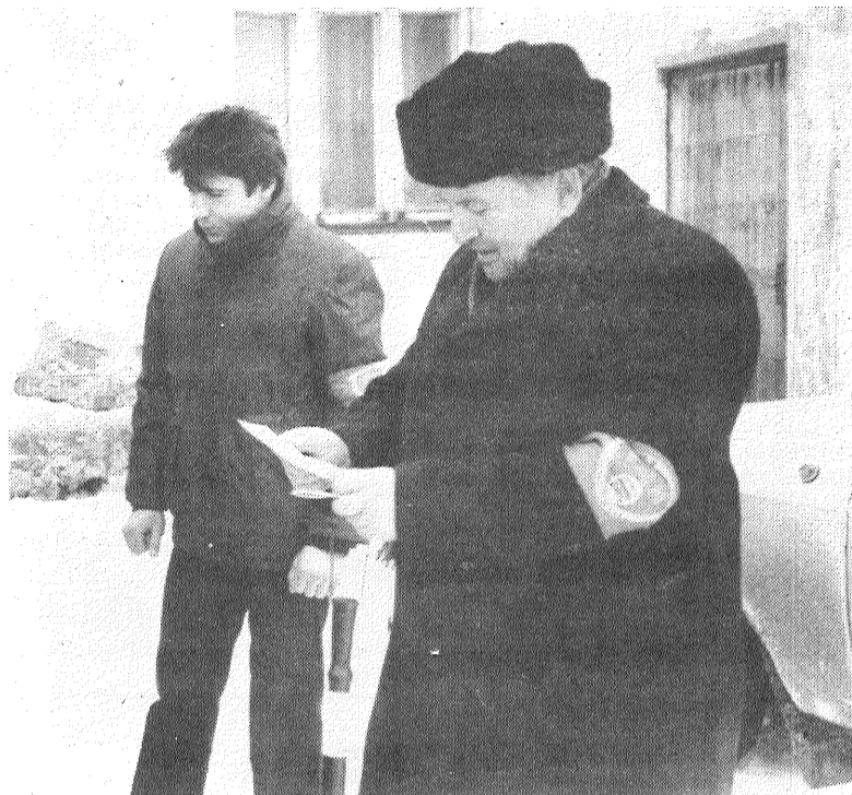
Kolhoza «Zelta vārpa» kārtības sargu vienībā ir vairāk nekā trīsdesmit locekļu. Cetpadsmit vīri specializējušies satiksmes drošības jautājumu kārtošānā, pārējie — gādā par teicamu noskaņojumu savā ciemā. Kolhoza kārtības sargi regulāri rīko reidus algas izmaksas dienās — tas vienu otru jau atturējis no draudzēšanās ar grādīgā dzēriena glāzi.