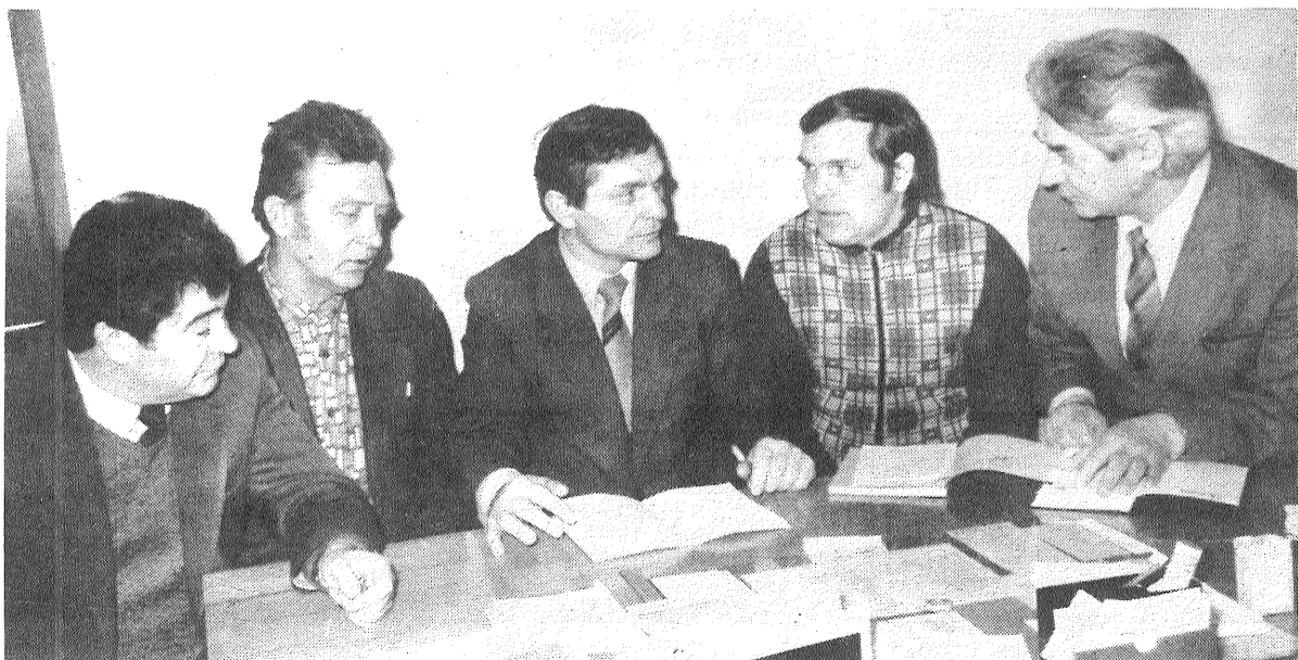
«Lauktechnikas» rajona apvienības kārtības sargu vienība pagājušajā gadā strādāja sparīgi, taču visus jautājumus vēl nokārtot nav izdevies. Un tāpēc vīri atkal un atkal liek prātus kopā — ko un kā darīt?