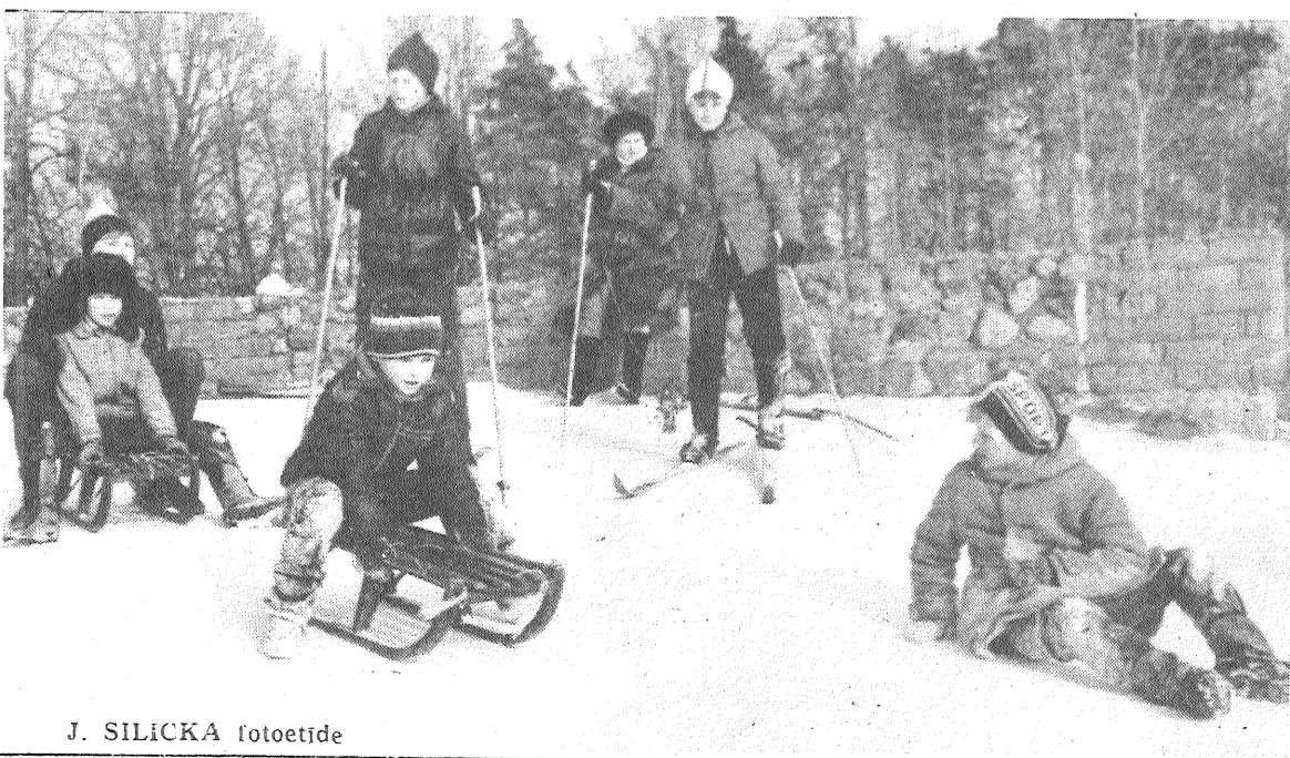
J. SILICKA fotoetide

Laikraksts «Leņina Karogs» iznāk otrdienās, ceturtdienās, sestdienās latviešu un krievu val.