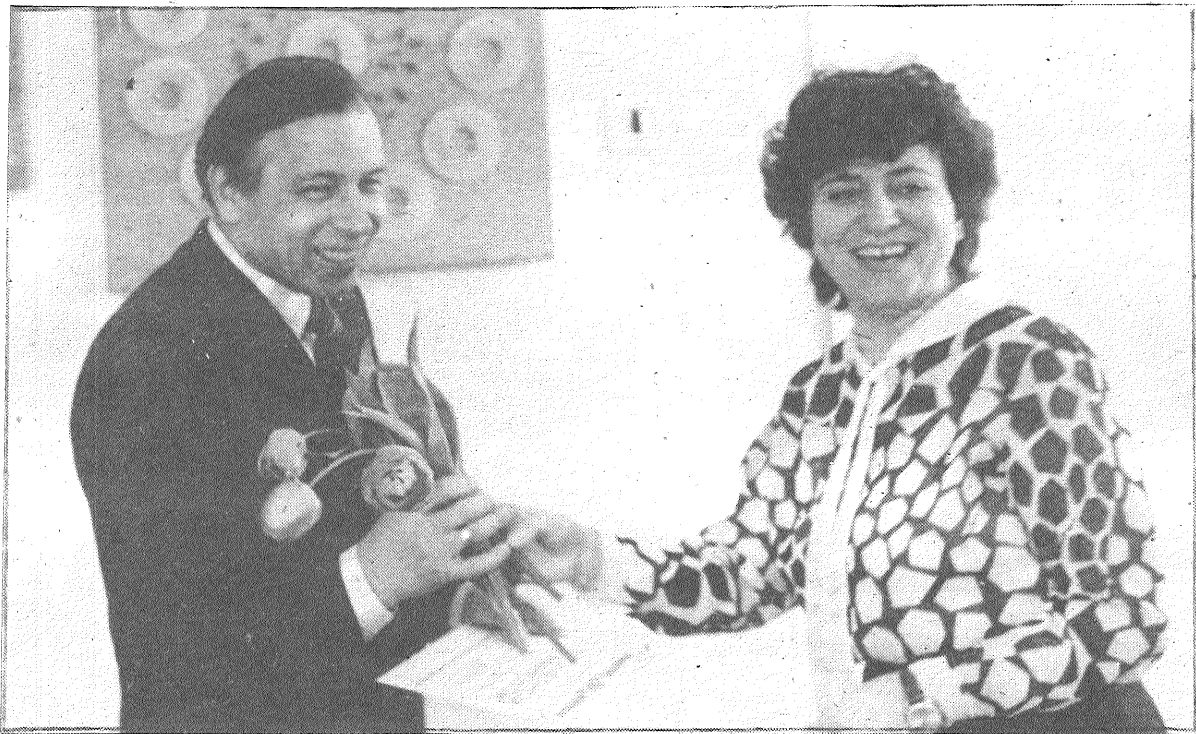
STASTAM PAR LIVĀNU EKSPERIMENTĀLĀS BIOĶĪMISKĀS RŪPNĪCĀS