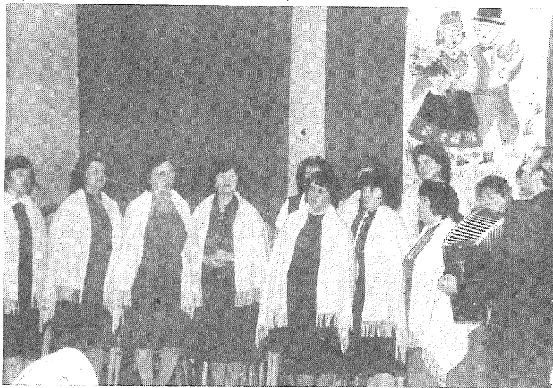
Dzied sievietes ansamblis.