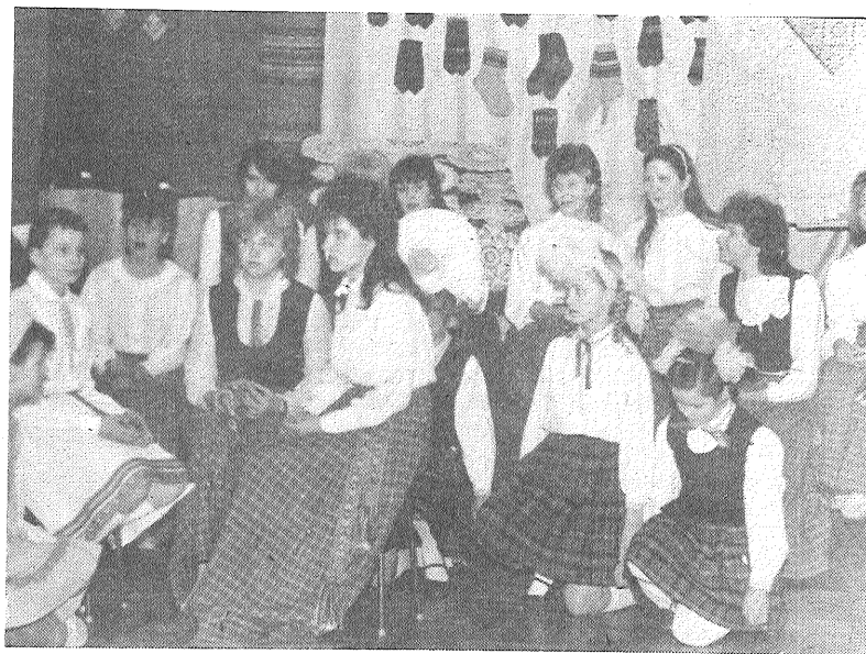
Skat dziesma «Trīs jaunas māšas».