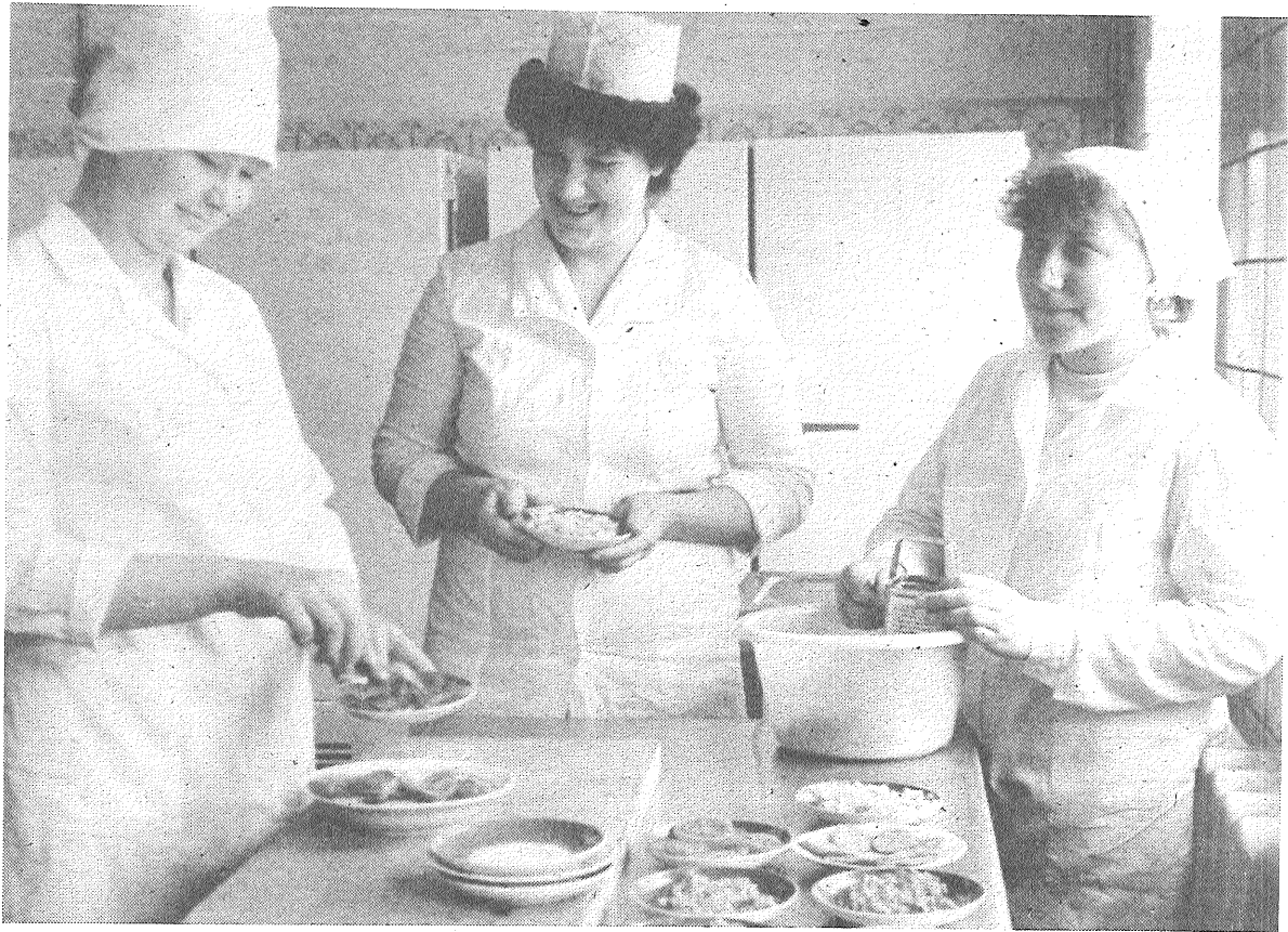
«Lauktechnikas» rajona apvienības materiāli tehniskās apgādes bāzes jaunajā administratīvajā korpusā (tas atrodas pie Aglonas dzelzceļa stacijas) sākusi darbu moderna ēdnīca. Tā tehniski labi apgādāta — ar ledusskapjiem, elektriskajām plītiņiem un dažādām citām iekārtām, ir pat speciāla krāsns bulciņu cepšanai.

Ar Sarkanā Karoga ordeni apbalvotajā Baltijas kara apbalva