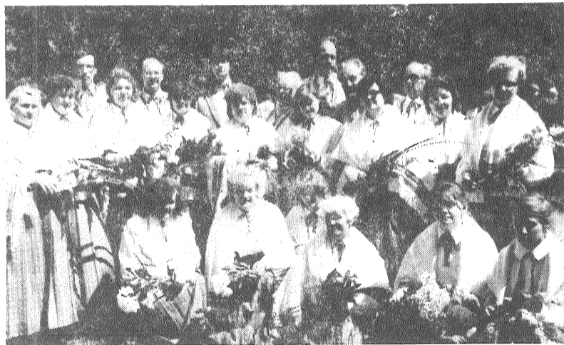
Līvānu kultūras nama kora dalībnieki.