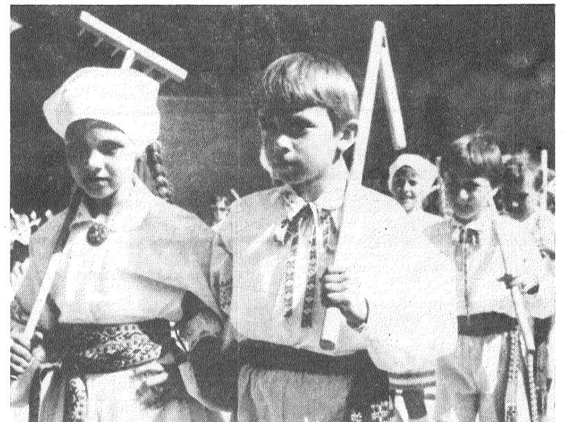
Kartojamiēs dejai ar grābekli šiem un sprigulīšiem.