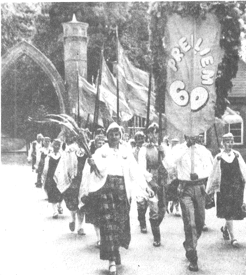
Svētku gājēns sacīes.