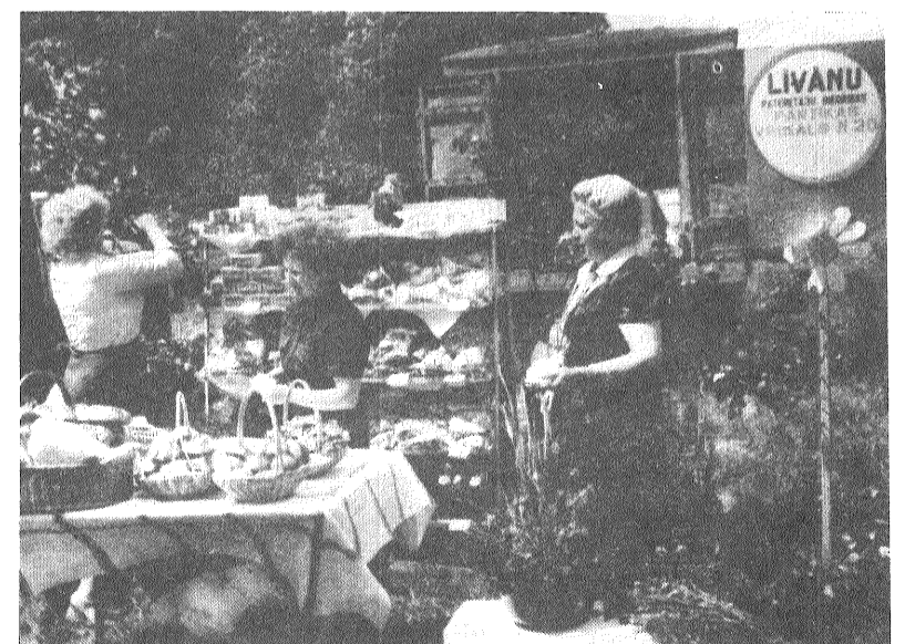
Sabiedriskās ēdināšanas uzņēmumu darbinieki bija parūpējušies par atspirdzinājumiem un kārumiem.