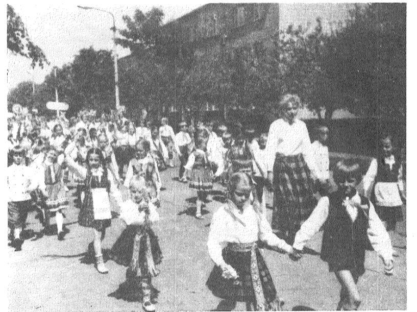
Jaunākās paaudzes dejotāji svētku gājienā.